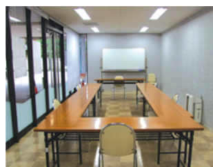
コミュニティルーム