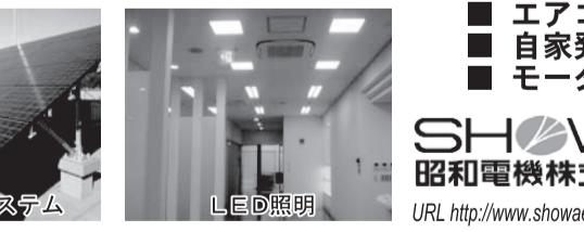
太陽光発電システム LED照明