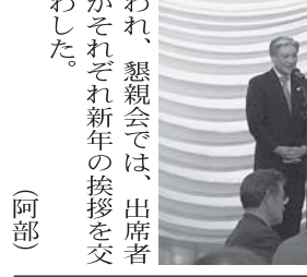
われ、懇談会では、出席者がそれぞれ新年の挨拶を交わした。(阿部)

知事との新春懇談会 県内商工会議所の 会頭・副会頭等出席 (一社)栃木県商工会議所連合会(北村光弘会長・宇都宮商工会議所会頭)は、1月10日(金)、宇都宮市内のホテルで「知事との新春懇談会」を開催。県内9商工会議所会頭や副会頭ら約50名が出席し、北村県連会長の挨拶や福田知事の挨拶が行