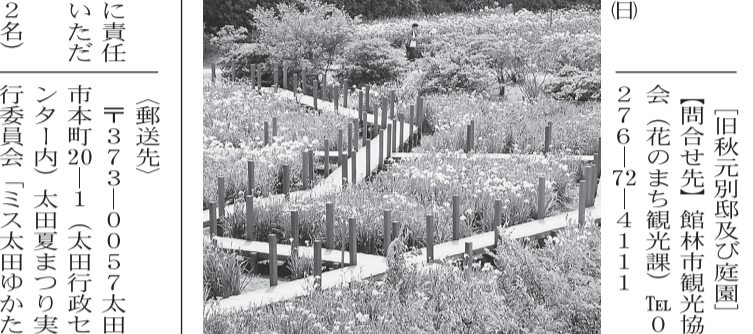
「旧秋元別邸及び庭園」 6月15日(土)・16日(日) 庭園

⑥「旧秋元別邸及び庭園」 6月15日(土)・16日(日) 庭園 ⑦「旧秋元別邸及び庭園」 6月15日(土)・16日(日) 庭園 ⑧「旧秋元別邸及び庭園」 6月15日(土)・16日(日) 庭園