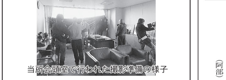
当所会頭室で行われた撮影準備の様子

【放送】 6月1日(土)スタート(連続4回) 毎週土曜 NHK BSプレミアム 午後11時15分～11時44分 【主なロケ地紹介】 ホクサンハモニーホール赤坂、佐野厄よけ大師、 星宮神社、朝日森天満宮、ホテル乃館、 ホテル三吉野別館、佐野商工会議所 他