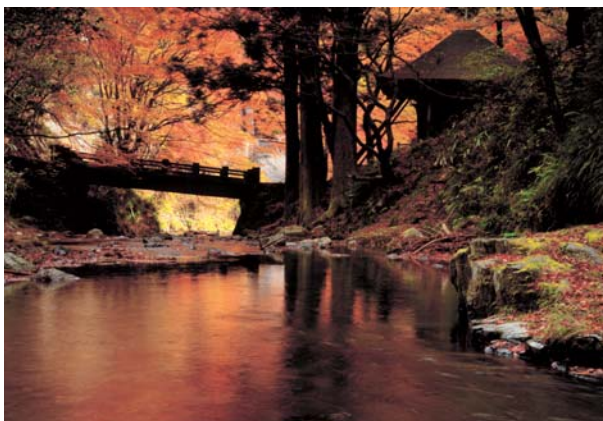
銀賞「ほうらいはしの秋景」 岡 實氏