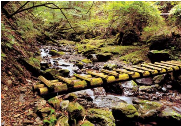
銀賞「源流を求めて」 番場 享氏