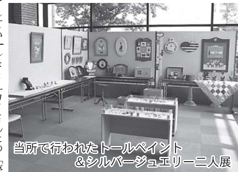
当所で行われたトールペイント&シルバージュエリー二人展

みこしや賑やかなおはやしパレードが行われ、まつりのフィナーレを飾った。 そのほかにも、駅前ステージやなかよしプレイランド等が行われ、当所まちなかサロンではトールペイント&シルバージュエリー二人展