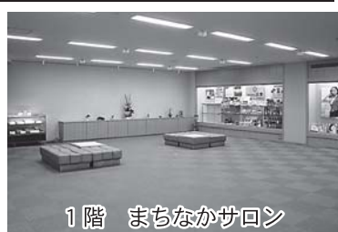
1階 まちなかサロン

当所では、様々なタイプの貸室をご用意しています。三階の会議室では、社員研修や会議などにご利用いただくことができ、一階「まちなかサロン」では、各種サークル・団体等の作品展覧等が開催できますので、是非ともご利用下さい。 (三階) ・大会議室(一八〇名) ※半分に仕切ってご利用できます。 ・中会議室(四八名) ・小会議室(二四名) (二階) ・コミュニケーションルーム(二四名) ②まちなかサロン 対面販売や入場料を伴ったイベントの利用はできません。 料金や利用基準等詳しくは、当所(TEL.21-5511)までお問合せ下さい。(阿部)