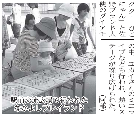
駅前交流広場で行われたなかよしプレイランド

みこしや賑やかなおはやしパレードが行われ、まつりのフィナーレを飾った。 そのほかにも、駅前ステージやなかよしプレイランド等が行われ、当所まちなかサロンではトールペイント&シルバージュエリー二人展