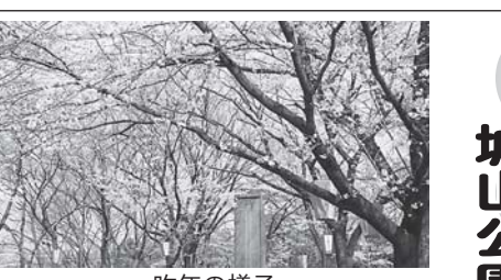
城山公園の夜桜を満喫

ボンポリとライトアップで 城山公園の夜桜を満喫 佐野市商連連合会（川崎元会長）では、今年も桜の開花に合わせて、城山公園及び周辺にボンポリ百二十六個を設置。ライトアップに協力するなど、夜桜見学で訪れる人々を喜ばせている。ライトアップは、今月十一日まで。（開花状況により期間変更の場合あり）協賛企業、団体等は次のとおり。（順不同・敬称略）