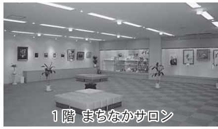
1階 まちなかサロン