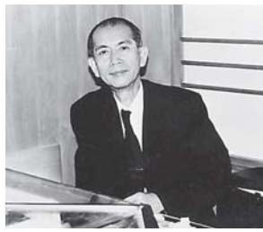
「相田みつをふるさと展」 四月二十五日(土)〜五月十七日(日) 午前十時〜午後六時