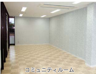
コミュニティルーム