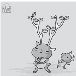
あなたの才能、シカで引き出す。商工会議所検定試験

現在、多くの企業が社員に対して簿記検定の資格取得を奨励しており、社会的に高い信頼と評価を得ています。先ごろは、若年者の就職を支援する厚生労働省の「YESプログラム」において、企業が採用にあたって重視している就職基礎能力の一つである「資格取得」に選