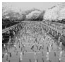
こいのぼりの里まつり

館林市観光協会では、五月十一日(日)まで第七回「世界一のこいのぼりの里まつり」を開催している。このこいのぼりの里まつりは、鶴生田川全域(成島町、尾曳町・約四km)をメイン会場に、近藤沼公園・つつじが岡パークイン・茂林寺川の四ヶ所合計五千匹を超えるこいのぼりを掲揚。平成十七年度には、掲揚数五二八三匹でギネス世界記録に認定された。また期間中のイベントとして、五月五日(月)に鯉のぼり巡りスタンプラリーが午前十時から午後三時まで各会場にて開催される。問合せは、館林市観光協会(Tel.0276-721-4111)まで。