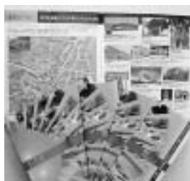
観光ガイドブック

桐生観光協会は、このたび「観光ガイドブック」を増刷し、配布を開始した。ガイドブックは縦二十cm、横十八cm、二十二頁構成で、表紙は地域の観光資源を放射状に配置し、「なつかしさと新しさが交わる不思議の街、桐生」をキャッチフレーズにしている。桐生の紹介では、市内を「本町」「梅田・川内」「相生・広沢」「新里」「黒保根」の五つのゾーンに分けて、それぞれ見開きページの中にマップと豊富な写真を配して、分かりやすく観光資源を紹介。このほか、主要なハイキングコース、イベントスケジュール、ルや種々の花の開花情報、近代化遺産や歴史探訪、七福神巡りコースなどおススメ観光コースの提案など盛りだくさんの情報を網羅している。また、飲食店やお土産情報、宿泊施設、公共交通機関の問合せ先なども掲載。問合せは、桐生商工会議所(Tel.0277-401188)まで。