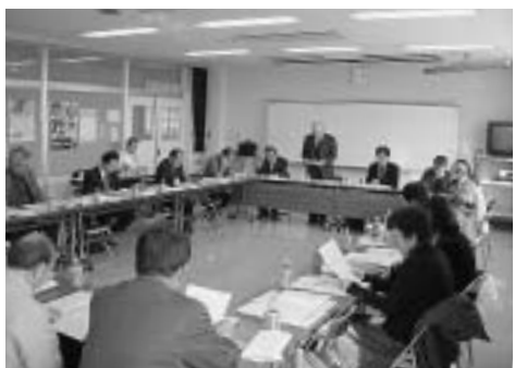
当所では、佐野商工会議所基本計画に基づき、会員