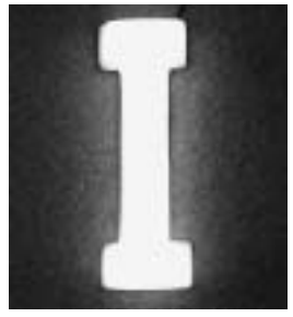
LEDを使った文字照明

LED(発光ダイオード)を使ってお店のPRをしませんか? LEDは電気代が安く、年間一〇〇〇円程度(六Wの場合)と低コスト。色も白や青をはじめ七色ある。お店の照明や部屋の間接照明として、またLEDの周波数を変えられることにより植物の発育を良くすることも出来る。看板として