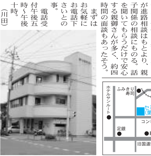
場所 佐野商工会議所3階会議室

「組立てラインを自動化したい、機械治具を製作したい等、生産効率にお悩みの業者・メーカー関係者は是非ご相談下さい。ニーズとご予算に合わせた最適な設計をご提供いたします」とのこと。まずは電話等でご連絡を!