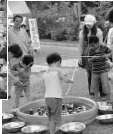
子供たちで賑わった 城山公園のなかよし プレイランド