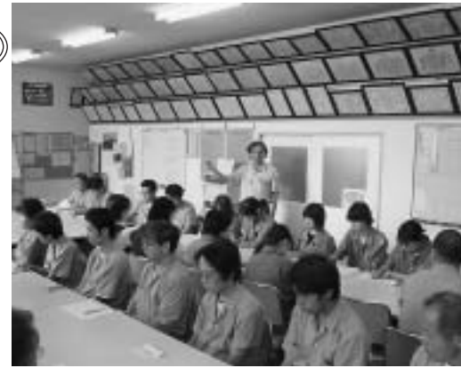
栃木県火災共済協同組合 は、県内の中小企業が相互 扶助の精神にもとづき、自 らの団結の力で自らの財産 を守ろうとする組織で、営 利事業ではありません。 しかも、一県にひとつし か認可されない極めて公共 性の強い組織であり、大火 等の異常な災害に際しては、 県の支払い保証や金融機関 の融資保証がなされており

安心です。いわば、中小企 業対策の一翼を担っている 組織であると言えます。 ●《特 色》 ●①掛金が安い ●営利を目的としないので 掛金が安く、経費節減 に役立ちます。 ●②支払いが早い ●万一の場合、直ちに査定 を行い、簡単な手続きで 共済金を支払います。 (青木)