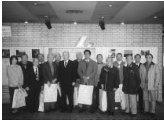
写真コンテスト入賞者のみなさん

当所では、中堅・中小企業の後継者対策や事業拡大の一貫として、東京商工会議所を中心とした「東商M&Aサポートシステム」との業務提携を行った。 このサポートシステムは、平成十年四月から東商を皮切りに現在十九商工会議所が加盟、相対的に不利な立場の売り手企業側をサポートする目的で、後継者難のオーナーや事業拡大を積極的に進める企業等から好評を得ている。M&A(合併と買収の意味)という、