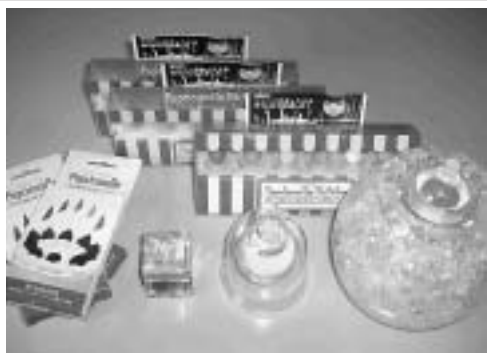
(左・後方)パブリキャンドル (右・前方)マジックコロナ

共和建設(株)では、経営革新の一環として、今年十月にインテリア雑貨部門を新たに開設。「パブリキャンドル」「マジックコロナ」の取扱を開始した。商品は、キャンドルとオイルタイプの