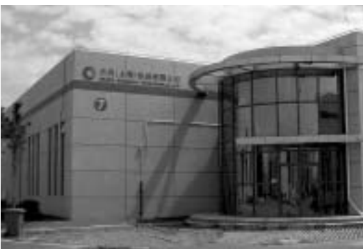
植上町、医師会通りにある小川産業(株)。一九四六年

会員事業所を無料で紹介するコーナーです。 掲載希望の方は、当所(TEL22-5511)までお電話下さい。