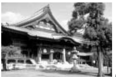
大光院開山忌にあわせ

麺のまち「うどんの里館林」振興会では、抽選で豪華賞品が当たるスタンプラリーを実施している。 ◇期限 10月31日(月)まで ◇内容 のぼり旗のあるスタンプラリー参加店で、お食事又はお買い上げいただくと、ハガキ(台紙)に1個スタンプを押印。 ◇対象者 参加37店舗のうち、ハガキに5種類の違った店のスタンプが押印された方。どんな組合せでも構いません。 ◇応募方法 期限までに事務局(館林市役所商工課)に郵送または持参するか、5個目のスタンプを押印した店に預けてください。 ◇賞品(うどん商品券) ・特賞(10,000円) 1人 ・1等(5,000円) 5人 ・2等(2,000円) 20人 ・3等(1,000円) 55人 ◇当選発表 11月下旬 問合せは、館林市役所商工課(☎0276-72-4111)まで。