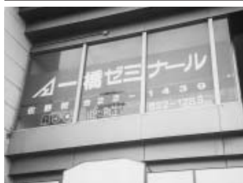
二対策に乗り出す

指す内容にならな... このチャンスをにチャレ... ンジしてみま... せんか。