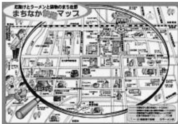
前回作成した「まちなか快遊マップ」

街の「い・い・と・こ」再発見 当所街づくり推進協議会では、中心市街地活性化のため、「ニューツーリズム街のいいところ再発見」をスローガンに、佐野中心市街地のタウンウォッチング(散策)を実施する。これは、地域の市民・住民・学生や通勤通学者及び市外からの来街者の皆さまに「まち」の地域資源を再発見して