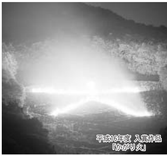
平成16年度 入賞作品 「かがり火」