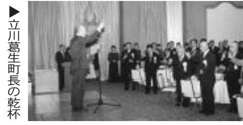
立川葛生町長の乾杯