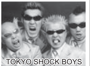
TOKYO SHOCK BOYS