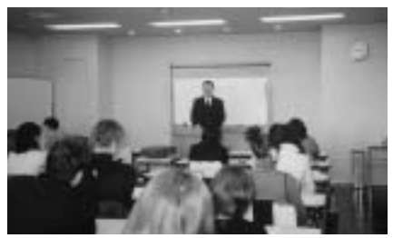
一層重要になっており、販売士の果たす役割は、今後ますます重要性を増す。

「販売士」は「わが国流通業界における唯一の公的資格」として浸透。消費者ニーズの多様化などにより、小売業従事者の資質向上は