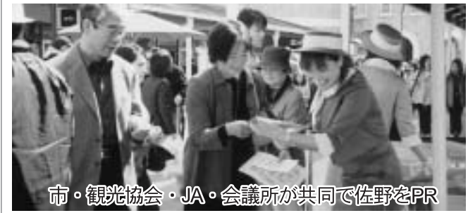
市・観光協会・JA・会議所が共同で佐野をPR

佐野プレミアムアウトレット開業一周年記念事業の一環として、三月十三日・十四日の二日間、佐野の特産品であるおとめ、合計八百名のお買い物を無料配布。併せて佐野の観光案内パンフレットを手渡した。今後は佐野コミュニティセンターでは、四者共同で佐野の特産品等を紹介していく。(林)