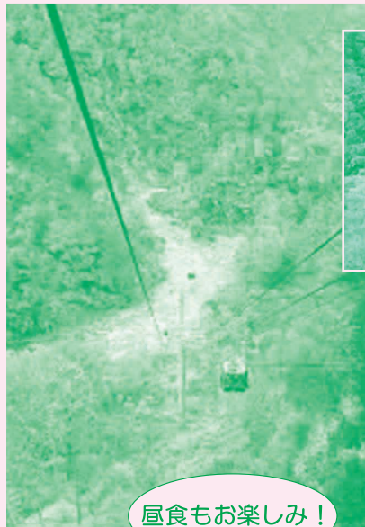
◀▼苗場ドラゴンドラ